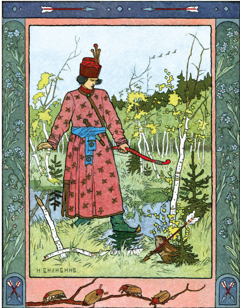
А у младшего сына, Ивана-царевича, стрела