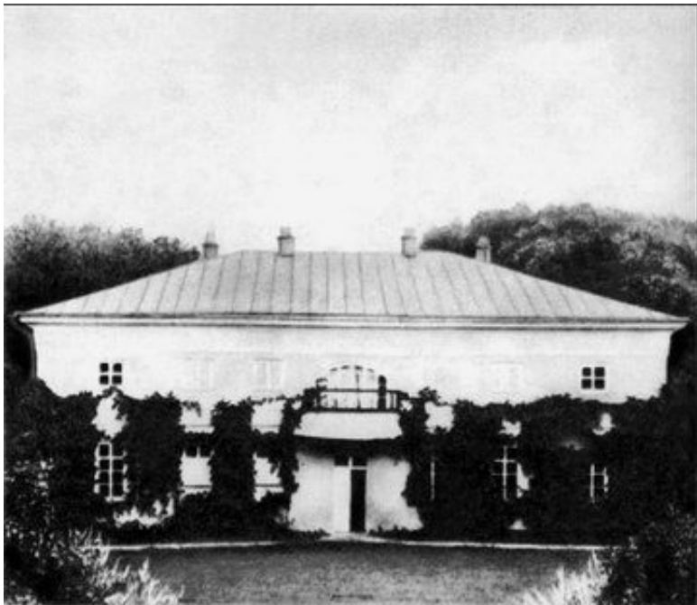
Дом А. А. Фета в Воробьевке