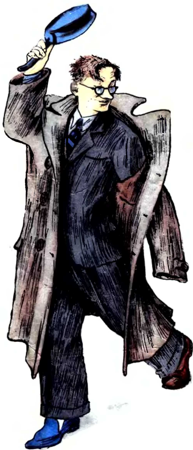
Вместо шапки на ходу Он надел сковороду.