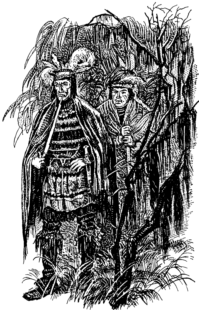
Вожди уже ожидали нас