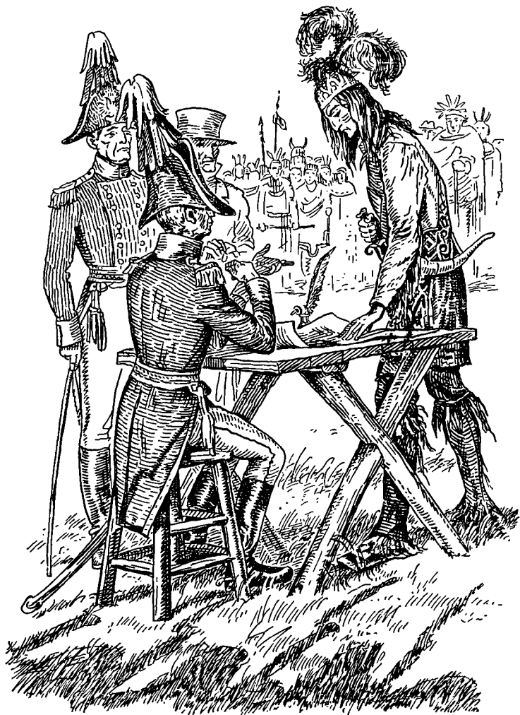
Оцеола пробежал глазами подписи