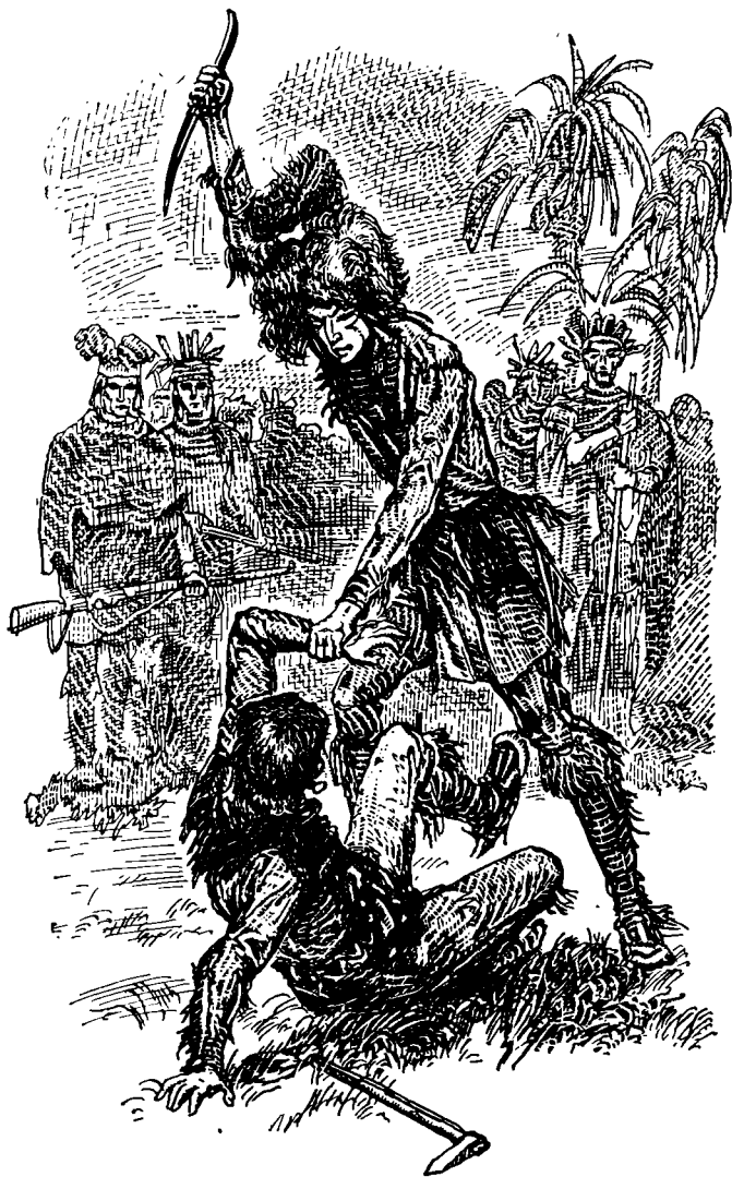
Оцеола поверг Омаглу на землю