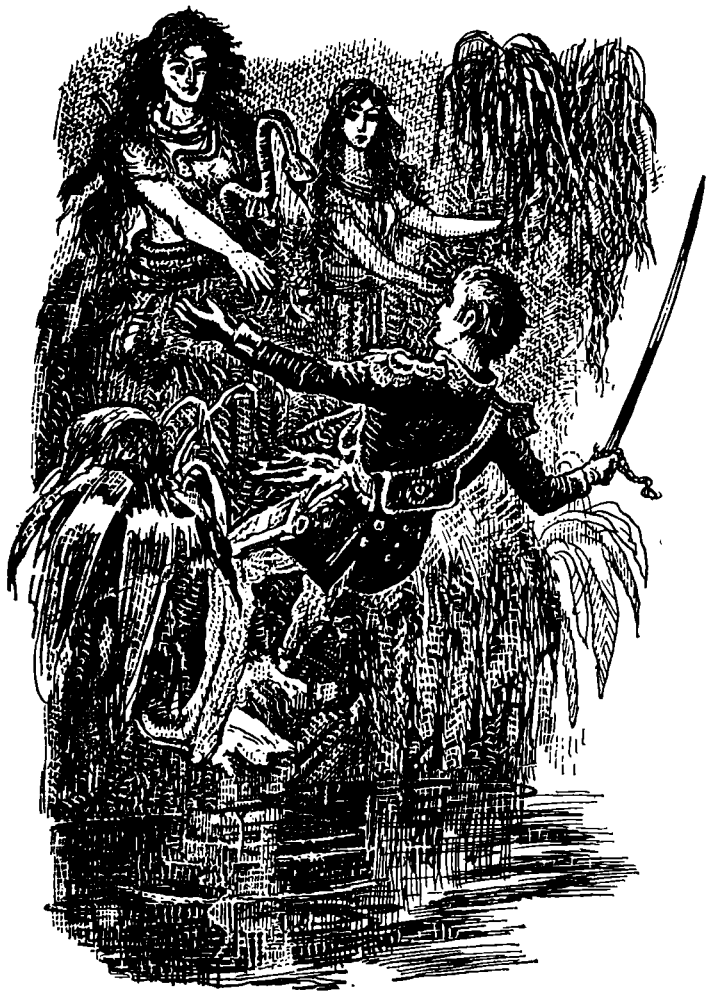
Скотт поскользнулся и полетел в воду