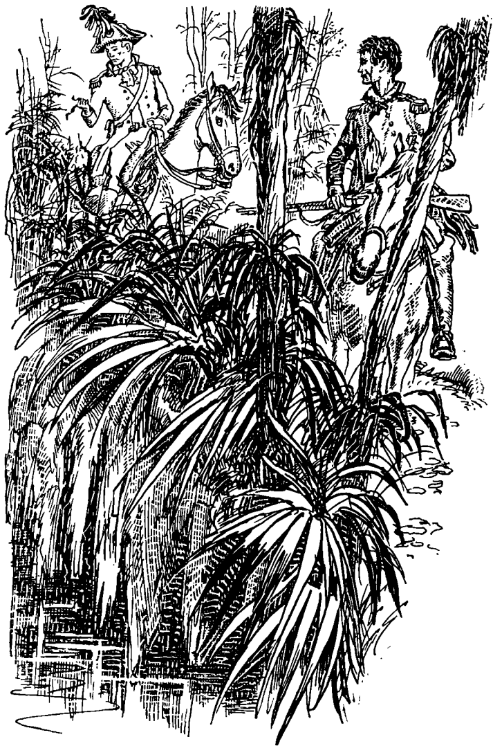
Галлахер с любопытством стал рассматривать ленту